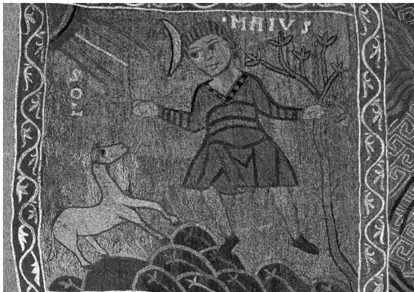
Fragment del Tapís de la Creació. Maig , representat com un home que condueix un cavall i sosté un arbre en flor. Amb la inscripció Maius — “Maig”.