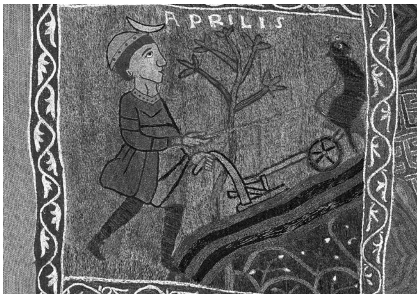
Fragment del Tapís de la Creació. Abril , representat com un home llaurant i amb la inscripció Aprilis — “Abril”.