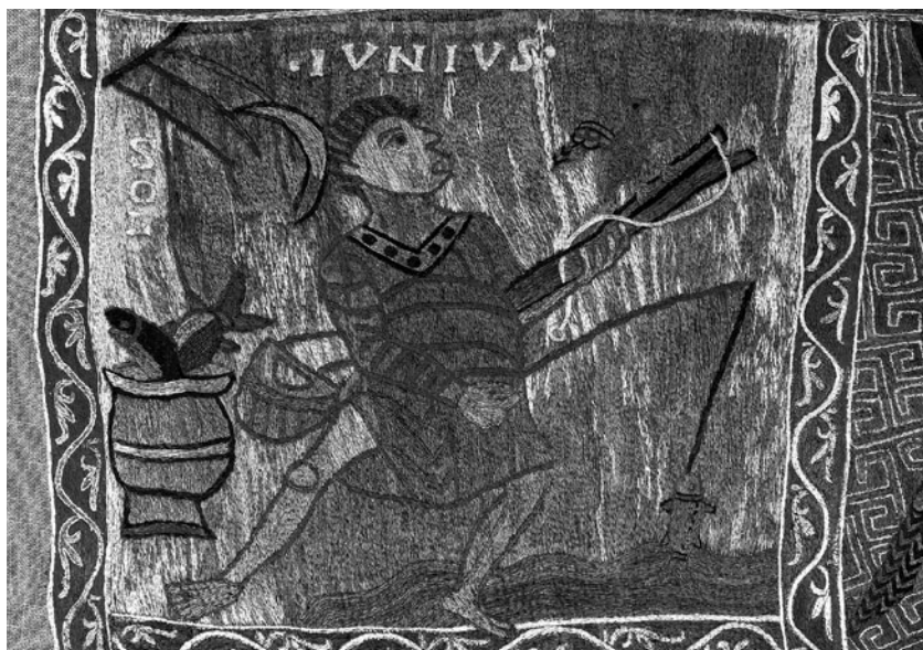
Fragment del Tapís de la Creació. Juny , representat per un pescador en el moment de treure un peix de l'aigua, amb la inscripció Iunius — “Juny”.