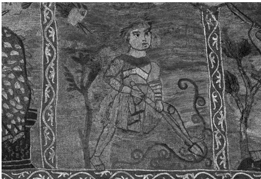
Fragment del Tapís de la Creació. La primavera , representada per un home que remou la terra del camp.