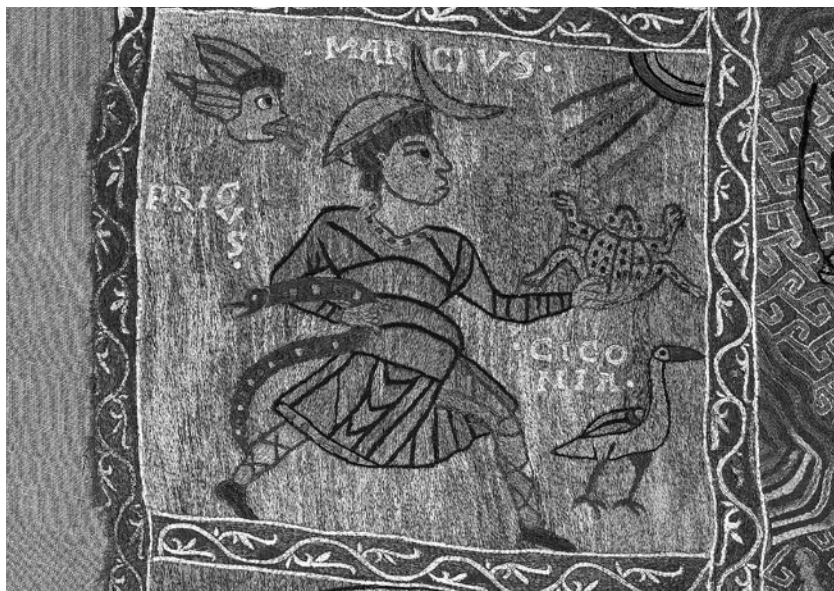
Fragment del Tapís de la Creació. Març , representat com un home amb una granota i una serp; damunt seu hi ha el sol i a baix una cigonya. Té les inscripcions Marcus, Frigus i Ciconia — “Març”, “Fred” i “Cigonya”.