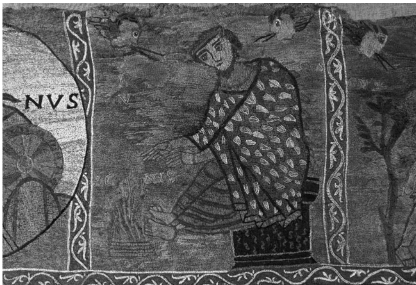
Fragment del Tapís de la Creació. L'hivern , representat per una dona que s'escalfa vora el foc amb la inscripció Calefaciens — "Escalfant-se".