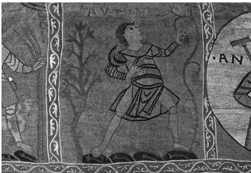
Fragment del Tapís de la Creació. La tardor representat amb un home recollint raïm i amb les inscripcions Autumnus i Nux — "Tardor" i "Nou".