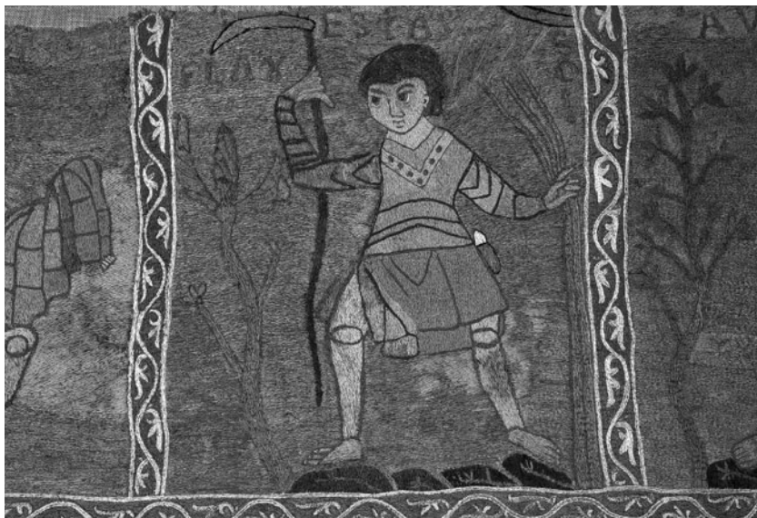
Fragment del Tapís de la Creació. L'estiu representat per un home amb les eines per trillar.