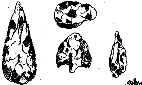
ROMANYÀ DE LA SELVA Puntes de fletxa de pedra picada, trobades en el dolmen.—Dibuix de E. RIBAS.

què en aquelles edats, fer-les quedar totes ben fetes com eren aquelles, era impossible.—JOSEP PAGÉS