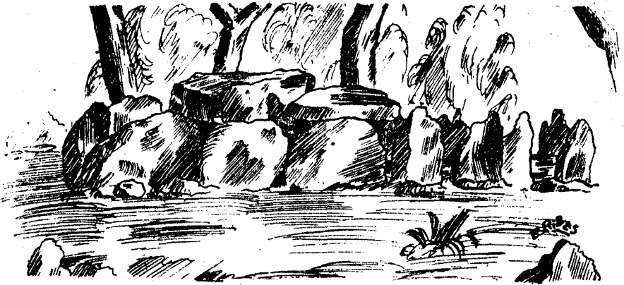
ROMANYÀ DE LA SELVA.—« La barraca d'En Daina », un dels dolmens més complets de Catalunya.— Dibuix del natural per E. RIBAS.