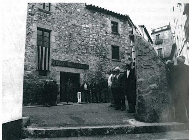
INAUGURACIÓ DEL MUSEU ARQUEOLÒGIC PEL CONSELLER DE CULTURA DE LA GENERALITAT SR. JOAQUIM FERRER.