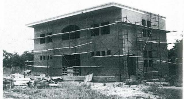
OCTUBRE 1986: INICI DE LES OBRES DE CONSTRUCCIÓ DEL DISPENSARI ALS TERRENYS DE L'ESTACIÓ.