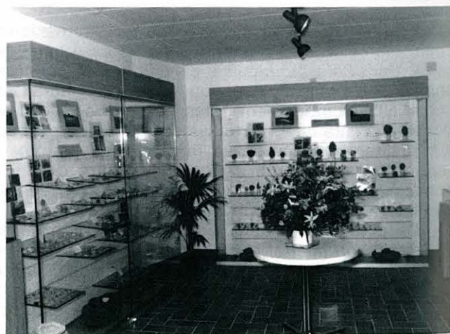
INTERIOR DEL MUSEU ETNOLÒGIC MUNICIPAL.