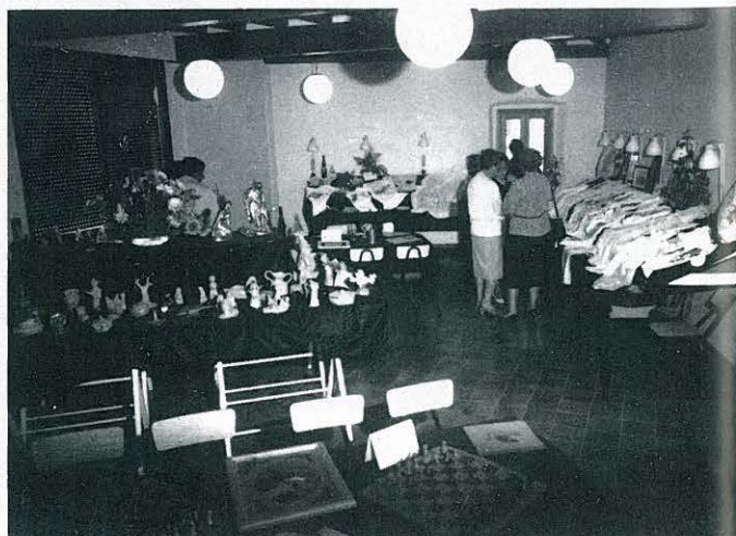
EXPOSICIÓ DELS TREBALLS D'ARTESANIA I MANUALITATS (FESTA MAJOR/87).