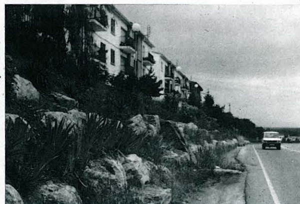
ENJARDINAMENT DEL C/ MARINA. ANY 1986.