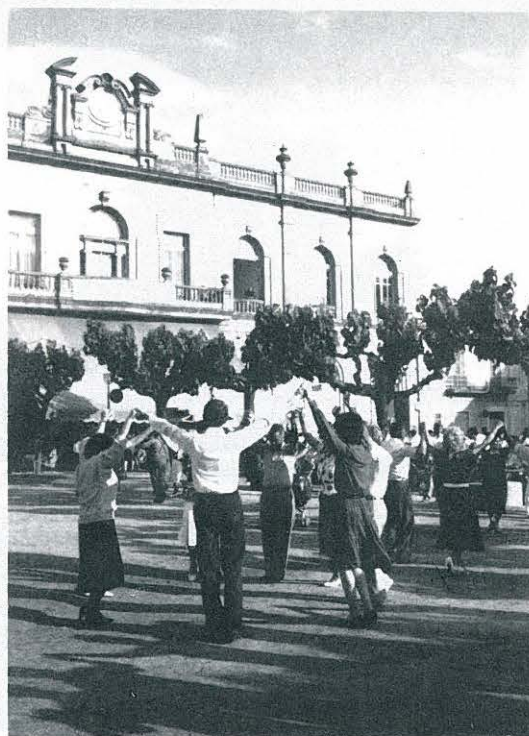
FESTA MAJOR 1987.