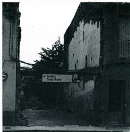
ADQUISICIÓ DE L'IMMOBLE DEL C/ DONZELLES NÚM. 33, EN SESSIÓ PLENÀRIA DEL 12-6-86, PER OBRIR UN NOU VIAL QUE COMUNIQUI EL CENTRE DE LA VILA AMB EL SECTOR «CAL CURT» I «MAS SEC».