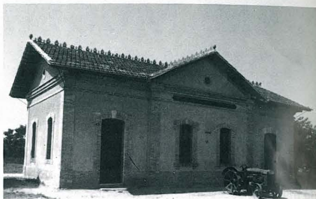
L'EDIFICI DE L'ESTACIÓ JA DESTINAT A MUSEU ETNOLÒGIC MUNICIPAL. OBERTURA: FESTA MAJOR 85. INAUGURACIÓ: 16-5-87. FAÇANA PRINCIPAL.