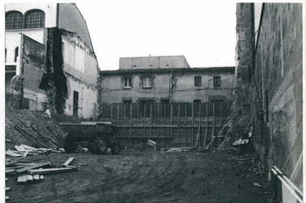
OBRES DE REMODELACIÓ I MILLORA DE LA RESIDÈNCIA-HOSPITAL «JOSEP BAULIDA», SEGONS PROJECTE APROVAT EN SESSIÓ CELEBRADA EL 19 DE GENER DE 1987.