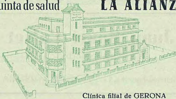
Clínica filial de GERONA

Esta Institución Mutualista, declarada de Beneficencia particular por R. O. el 12 de Mayo de 1915,