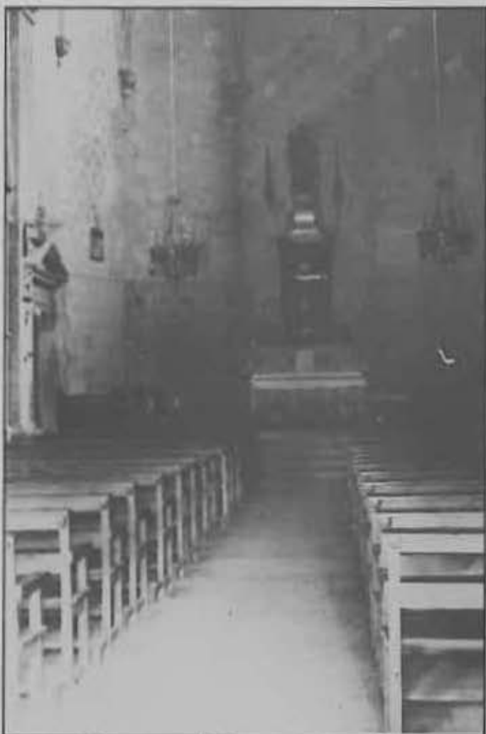
Interior de l'església sense el sostre de l'Altar Major, que va ser destruït l'any 1836.