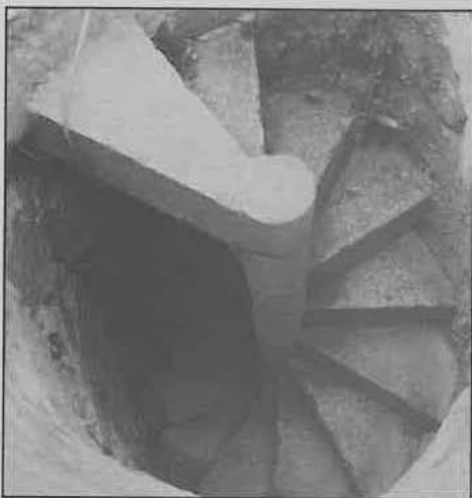
Escala de cargol de pedra per accedir a l'últim nivell del campanar.