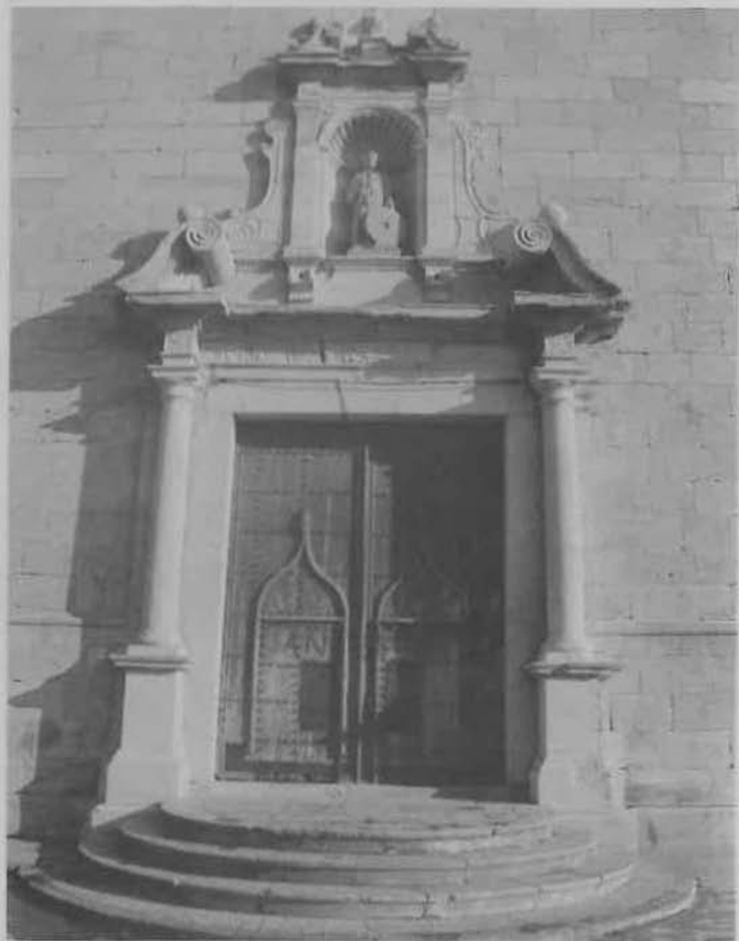
El llarg acabament de l'església de Llagostera (segles XVII - XVIII)