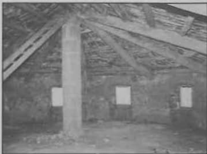
Espai entre la volta i el sostre a la zona de l'altre

Sobre l'aspecte econòmic, neguen el deute, així com la manca de manobres. Els tractes foren de donar 132 lliures i 19 sous cada tres