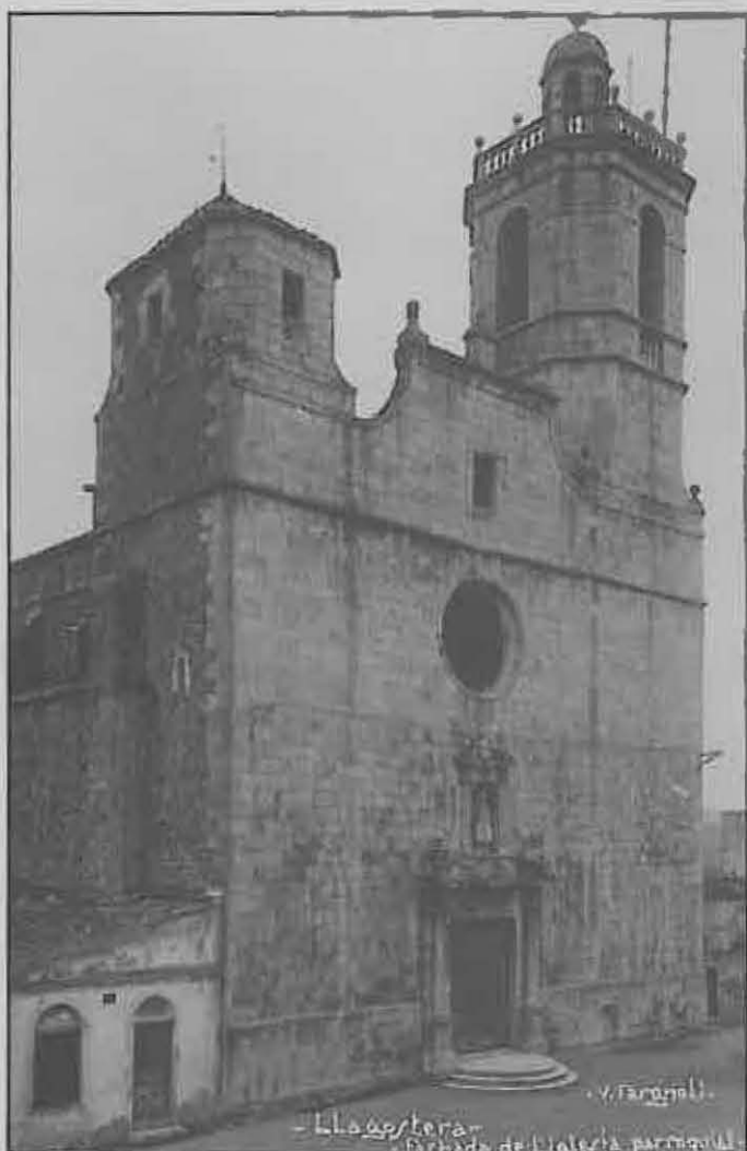
Façana de l'església de Sant Felis de Llagostera

Sembla que no hi ha dubte que el 1648 es cobreix