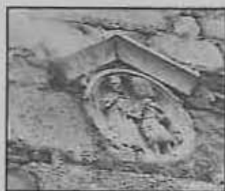
Element decoratiu de la primitiva església romanica incorporat a la façana sud del campanar.

Aquestes obres d'art que avui contemplem són fruit d'un important sacrifici dels veïns, ja fos en diner, en espècie (part de la collita), o físic (el transport).