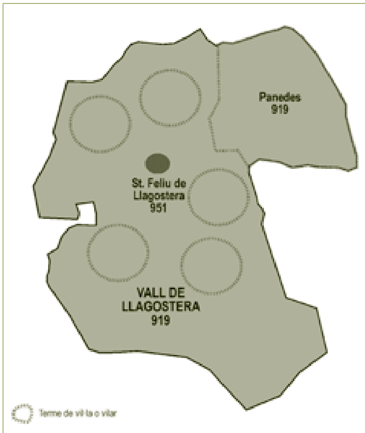
Mapa 3.8. La vall de Llagostera, segles IX-X

segle XII es documenta el lloc del Vilar, un veïnat on s'assentà el llinatge de cavallers dels Vilar, titulars d'una part del delme de Santa Pellaia el 1196 i el 1252. 40