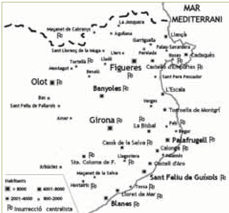
Mapa 10.2. La insurrecció centralista a les comarques gironines

xidors, ja que Joan Muns, president de la “unió” catalana d’associacions de teixidors, va tenir un paper destacat a la insurrecció. Figueres, per altra banda, era la població de naixement d’Abdon Terradas –el “pare” del republicanisme català–, on fou elegit alcalde 5 vegades, tot i la repetida anul·lació de les eleccions per part de la Diputació provincial. Dades referides al Bienni Progressista ens mostren una base social republicana de professions urbanes amb molt escassa presència de sectors rics i dividida entre treballadors –11,3%– i artesans modestos –34,1%– per una banda, i artesans més benestants, botiguers, algun professional liberal i algun comerciant i propietari –50%– per altra. Aquest segon grup, que pagava entre 100 i 500 rals de contribució, era un grup clarament més benestant que la majoria de la població. El mateix pare d’Abdon Terradas era un comerciant de grans i ell un fabricant d’adobats que el 1855 pagava 554 rals per les seves propietats urbanes de Figueres –encara que ni cinc per industrial– i que era l’arrendatari dels drets de consums de la població. Difícilment la seva capacitat de mobilitzar homes armats –50 el 1842, per exemple, per proclamar la república a la Vajol– i el seu prestigi a la zona eren aliens a la seva posició social.