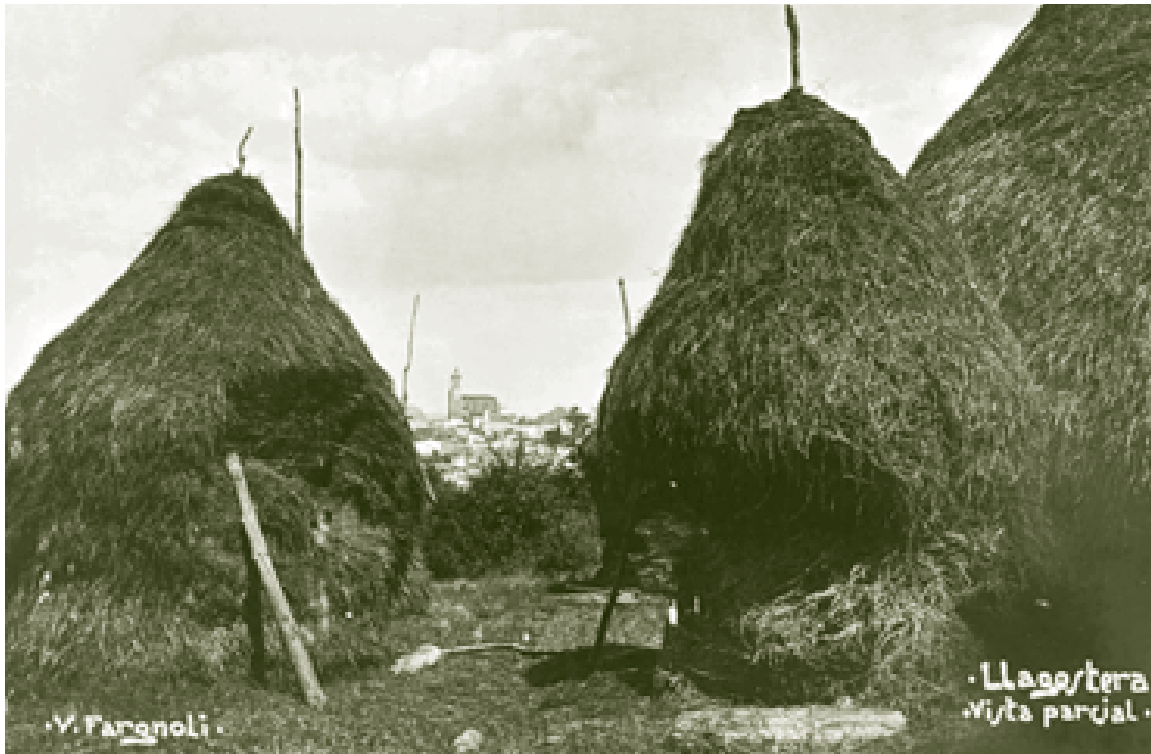
Figura 7.2. Pallers amb el poble de Llagostera al fons

peces de terra, hi havia arbres com les dues feixes “ amb arbres surers ” que s’identifiquen a Panedes el 1319. 5